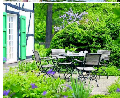
Gärten für jedes Bedürfnis mit Wasserstellen und Sitzplätzen.